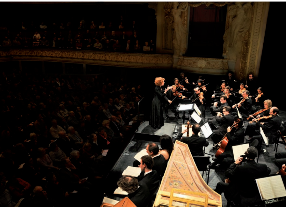
Emmanuelle Haïm, Le Concert d'Astrée