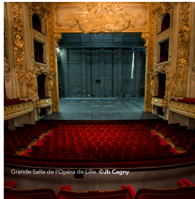
Grande Salle de l'Opéra de Lille