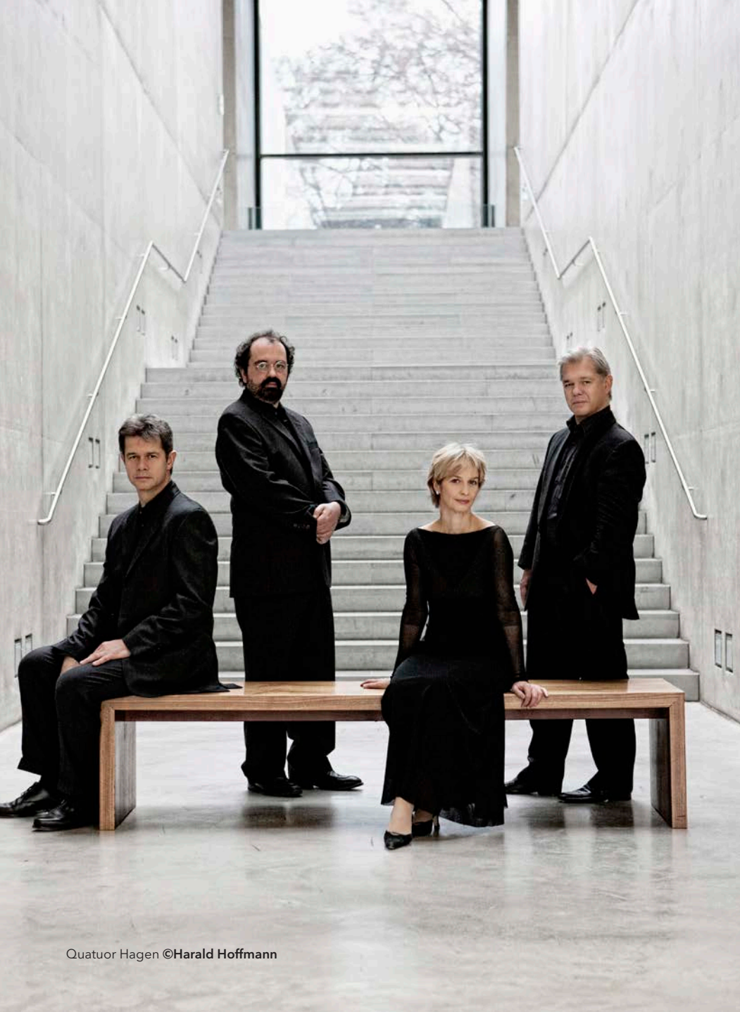
Quatuor Hagen