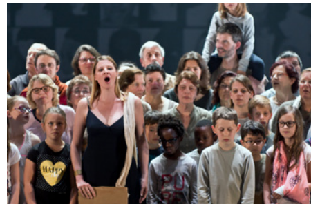
Saison 15-16 Le Monstre du labyrinthe Opéra de Jonathan Dove