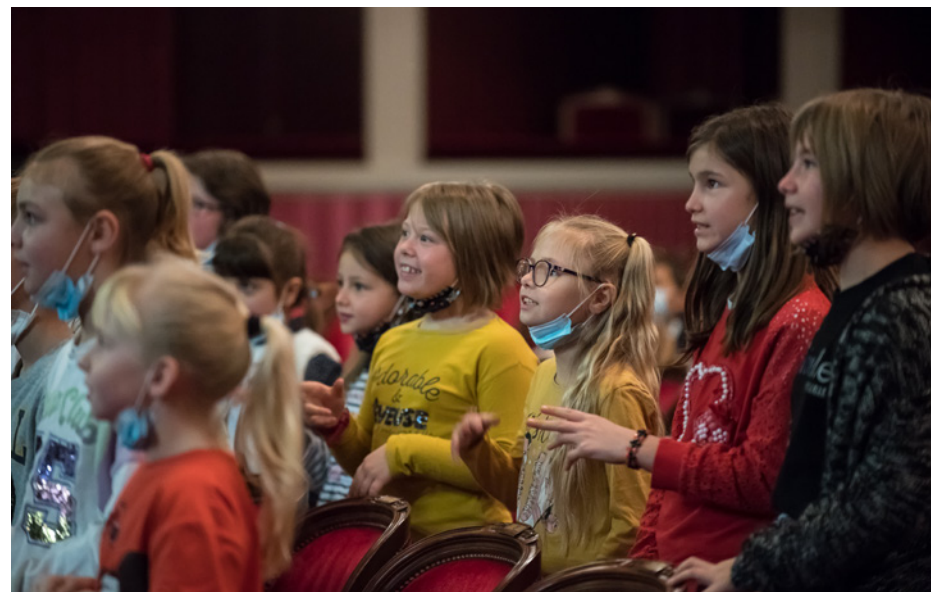
Les enfants des 19 ateliers Finoreille réunis à l'Opéra de Lille en novembre pour répéter avec les musiciens de l'ESMD.