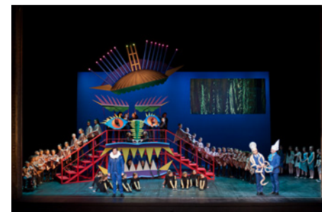
Saison 19-20 Les Noces, variations, adaptation des Noces de Figaro commandée au compositeur Arthur Lavandier et à la metteure en scène Maëlle Dequiedt.