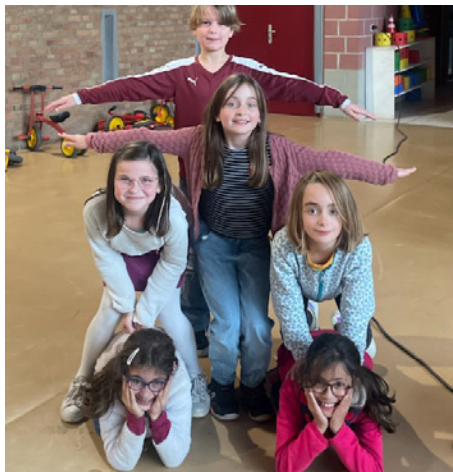
Les enfants de l'atelier de Vauban créent leur propre inukshuk.

Chez les Inuits, l'inukshuk est un monument fait de pierres empilées. Il évoque une forme humaine et sert de repère. Il est devenu symbole de fraternité, d'entraide mutuelle et de solidarité.