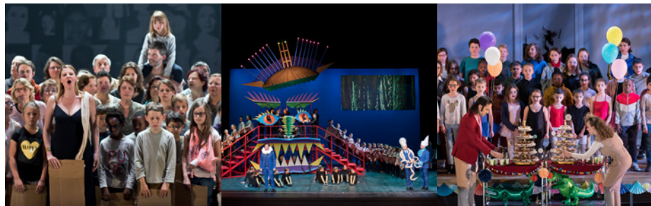
Saison 15-16 Le Monstre du labyrinthe Opéra de Jonathan Dove