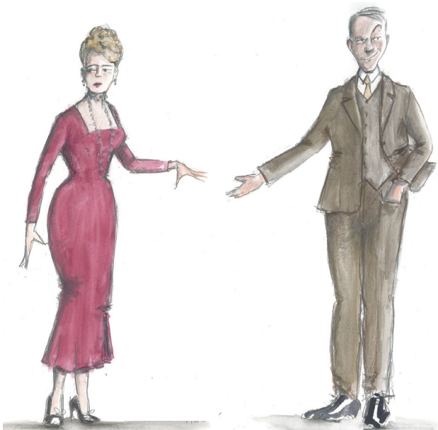
Croquis de Laurent Pelly pour les costumes de Caroline et Duparquet

L'action se déroule dans la petite ville de Pincornet-les-Bœufs, un soir de réveillon.