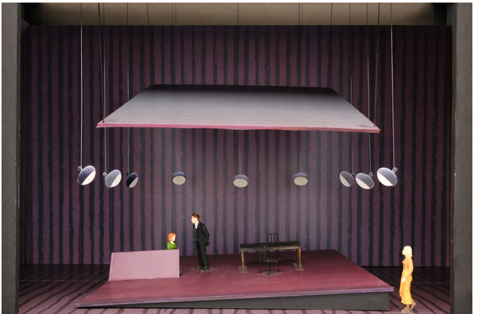
Images du projet scénographique