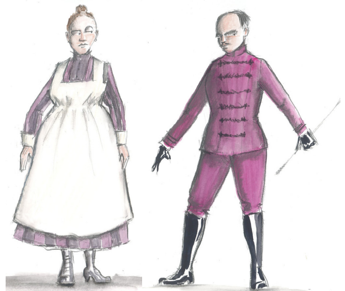
Croquis de Laurent Pelly pour les costumes d'Adèle et Orlofsky