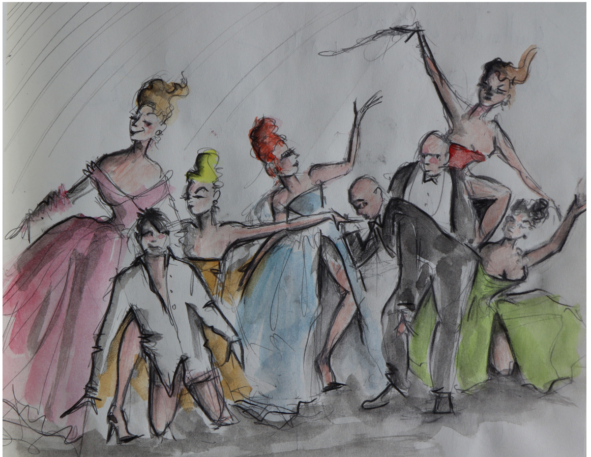
Croquis de Laurent Pelly pour La Chauve-Souris