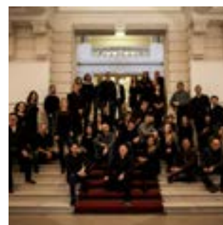
CHEUR DE L'OPÉRA DE LILLE