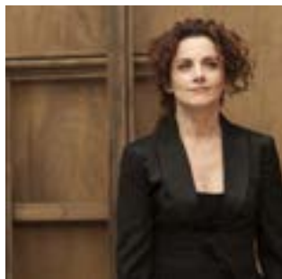
EMMANUELLE HAÏM direction musicale