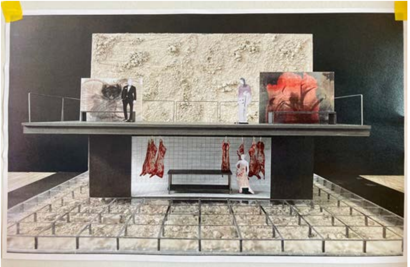
maquette Don Giovanni © Guy Cassiers

« La scénographie que je conçois pour l'opéra de Mozart est l'expression d'un monde en déclin . Le sol transparent du plateau laisse deviner, en dessous, les ruines d'un monde perdu . Cet espace souterrain est plus éclairé au deuxième acte et prend tout son sens vers la fin de la représentation, avec la chute de Don Giovanni. Se révèle immédiatement une importante dynamique scénique du spectacle. Il existe au moins deux mondes : celui de l'histoire de Don Giovanni, par-dessus un autre monde annonciateur de déclin, comme un abîme qui s'ouvre lentement. »