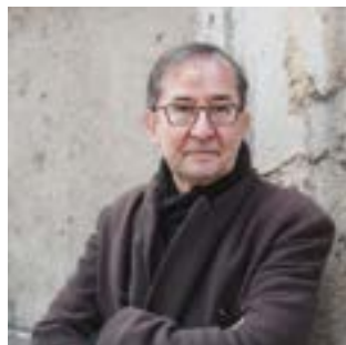
GUY CASSIERS mise en scène