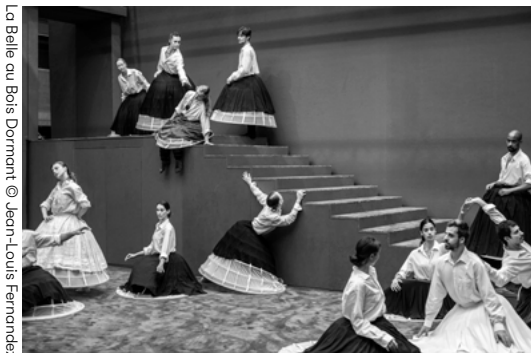
La Belle au Bois Dormant

Cet abécédaire propose des pistes pour explorer l'œuvre tout en permettant d'appréhender les multiples facettes de celle-ci.